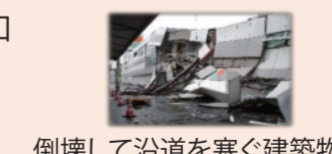
倒壊して沿道を塞ぐ建築物

緊急輸送道路の沿道建築物や、昭和56年以前に着工された木造住宅に対する耐震診断、耐震補強設計、耐震工事への支援