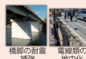
橋脚の耐震補強 電線類の地中化