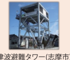
津波避難タワー(志摩市)