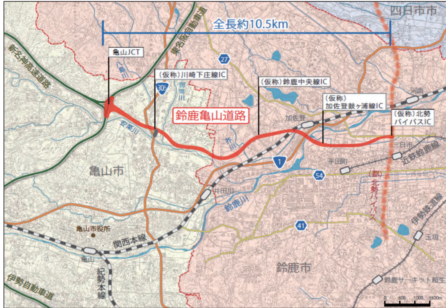
鈴鹿亀山道路都市計画図より(亀山市部分)